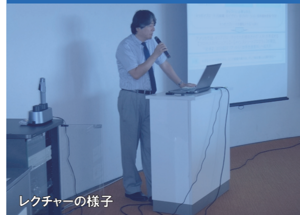
レクチャーの様子