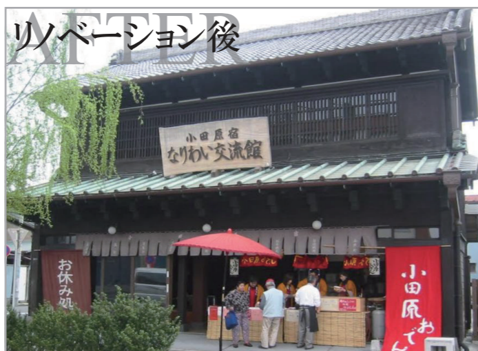
リノベーション後