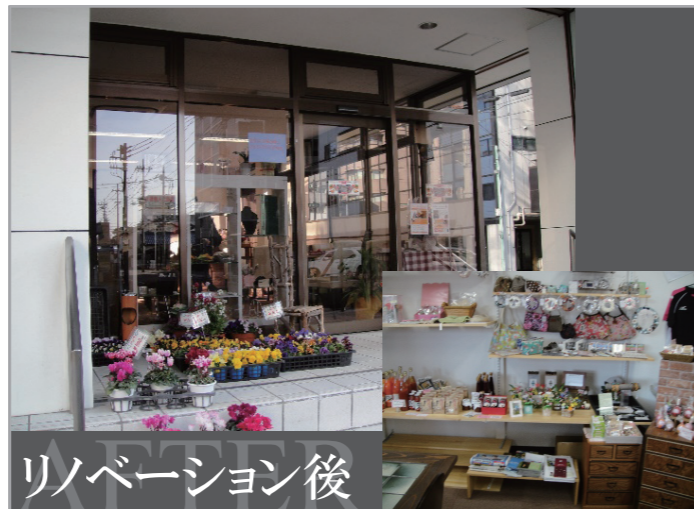
リノベーション後