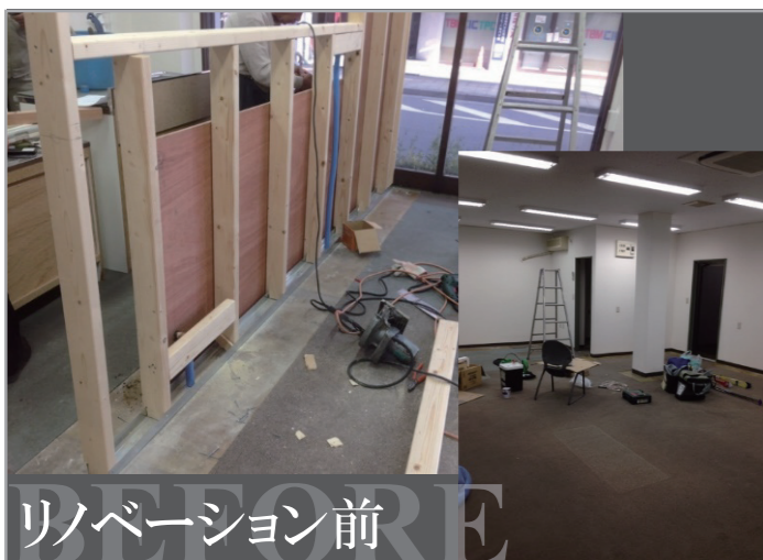
リノベーション前