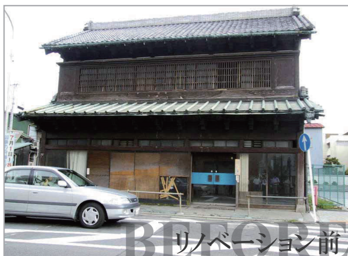
リノベーション前