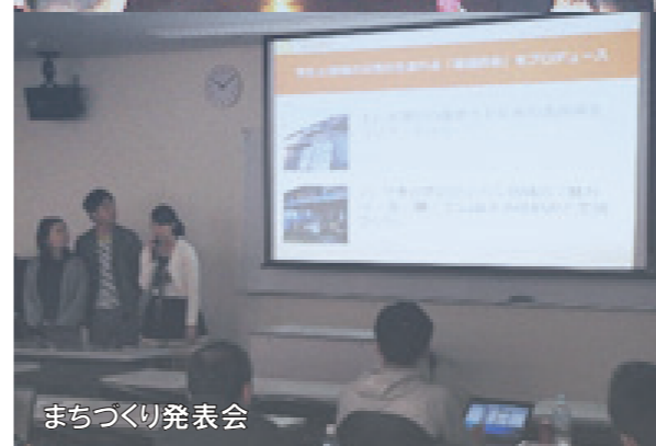
まちづくり発表会