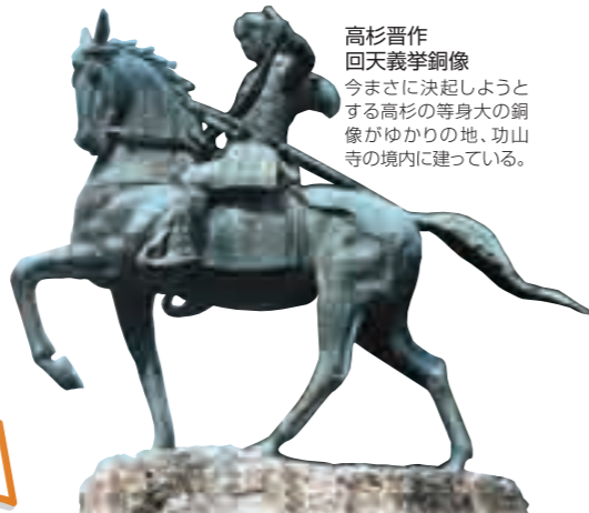
高杉晋作 回天義挙銅像 今まさに決起しようとする 高杉の等身大の銅像がゆかりの地、功山 寺の境内に建っている。