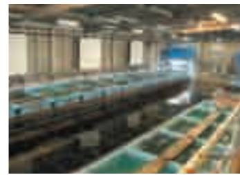
日本最大級「ふく水槽」 ふくの中でも最高峰といわれる「と らふく」が悠々と泳ぎまわっている。

料理の後は、響灘を見ながら、ゆ っくりと本場のふくに舌つづみ。 見る・学ぶ・味わうをテーマに、下 関のフグを満喫!