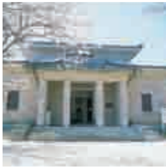
下関市立長府博物館 長府毛利家の遺品や坂本龍馬起草 の「新政府綱領八策」など、幕末期を 中心に多数の資料を収蔵・展示して ある。また、隣接して明治維新を中心 とした国事に命を捧げた名も無き人々 の霊を供養するための万骨塔(ばん こつとう)がある。塚には「一将功成 って万骨枯る」の碑と全国から寄せ られた石が供えられている。