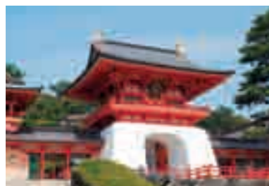
赤間神宮 源平壇之浦の合戦に破れ、わずか8歳で関門海峡に入水された安徳天皇を祀っている。壇之浦を望む水天門は「海の中にも都はある」という二位の尼の願いを映したといわれる鮮やかな竜宮造り。