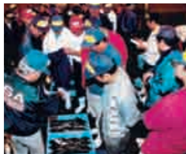
南風泊市場 セリは「袋セリ」と言われ、セリ人と業者が布袋に手を入れ、指先で値段を決める独特のもの。