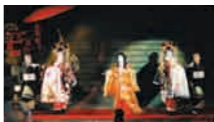
ドラマシアター「海峡千年・時代絵巻」

下関を舞台に繰り広げられた歴史ドラマを綴った舞台劇。源平の戦いに始まり、怪談『耳なし芳一』、巖流島の決闘、幕末が舞台の奇兵隊、また、赤間神宮の上臈参拜等、優雅な世界も特別再演。