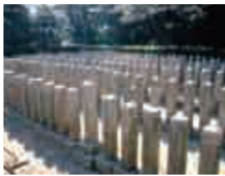
桜山神社(招魂社) 高杉晋作の発議により創建され、 慶応元年落成。招魂社としては日本 で最初といわれている。吉田松 陰を中心に、高杉晋作、久坂玄瑞、 山県有朋等、維新に散った志士や 奇兵隊たち396柱が祀られている。