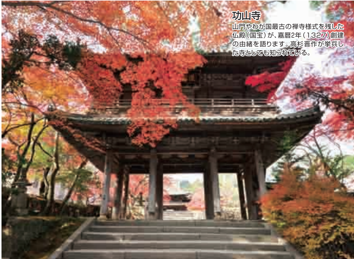
功山寺 山門やわが国最古の禅寺様式を残した 仏殿(国宝)が、嘉暦2年(1327)創建 の由緒を語ります。高杉晋作が挙兵し た寺としても知られている。